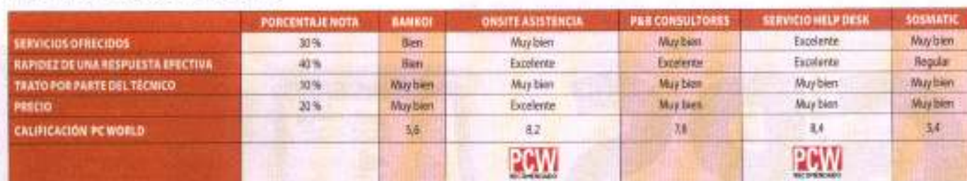
TABLA DE CALIFICACIONES

ventana del asistente para la importación, donde debemos seleccionar los apartados que hemos mencionado anteriormente.